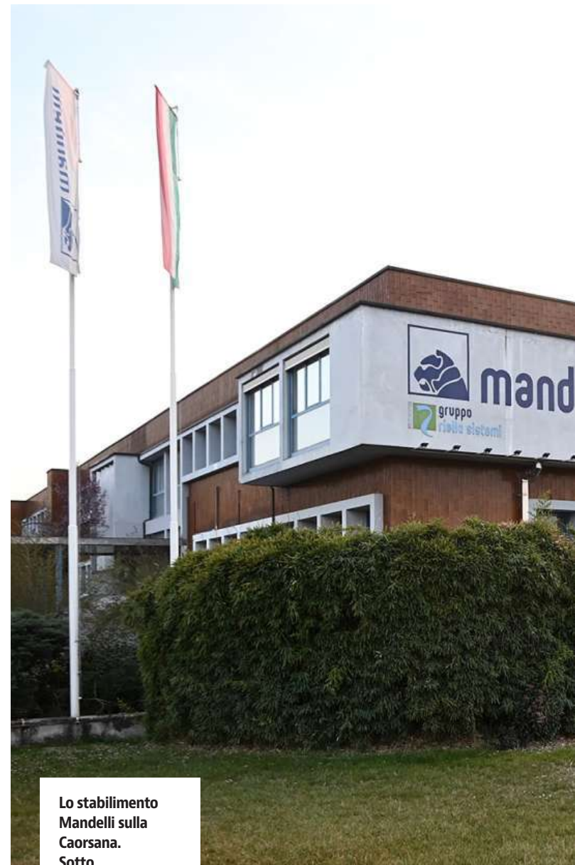
Lo stabilimento Mandelli sulla Caorsana.

I prossimi passaggi prevedono che l'8 luglio sia il termine per l'atto di acquisto, nel contempo verrà fatto un inventario, entro il 30 giugno il passaggio dei dipendenti alla nuova azienda. Mandelli è stata acquisita per una cifra che, a quanto pare, si aggira su qualche milione di euro, il prezzo del marchio principalmente, ma con il presupposto di spenderne più che altrettanti per far girare la macchina e mettendo in conto che i primi tempi saranno in perdita.