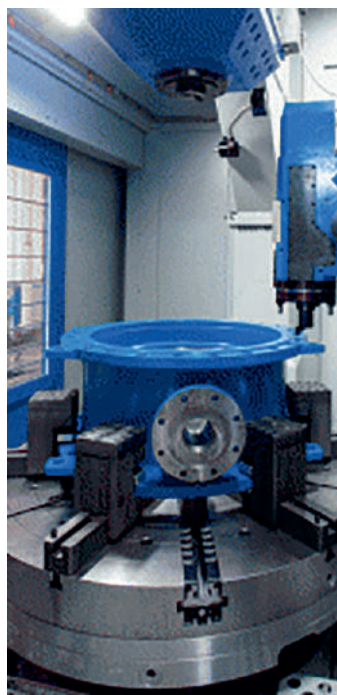
Una lavorazione in Mandelli